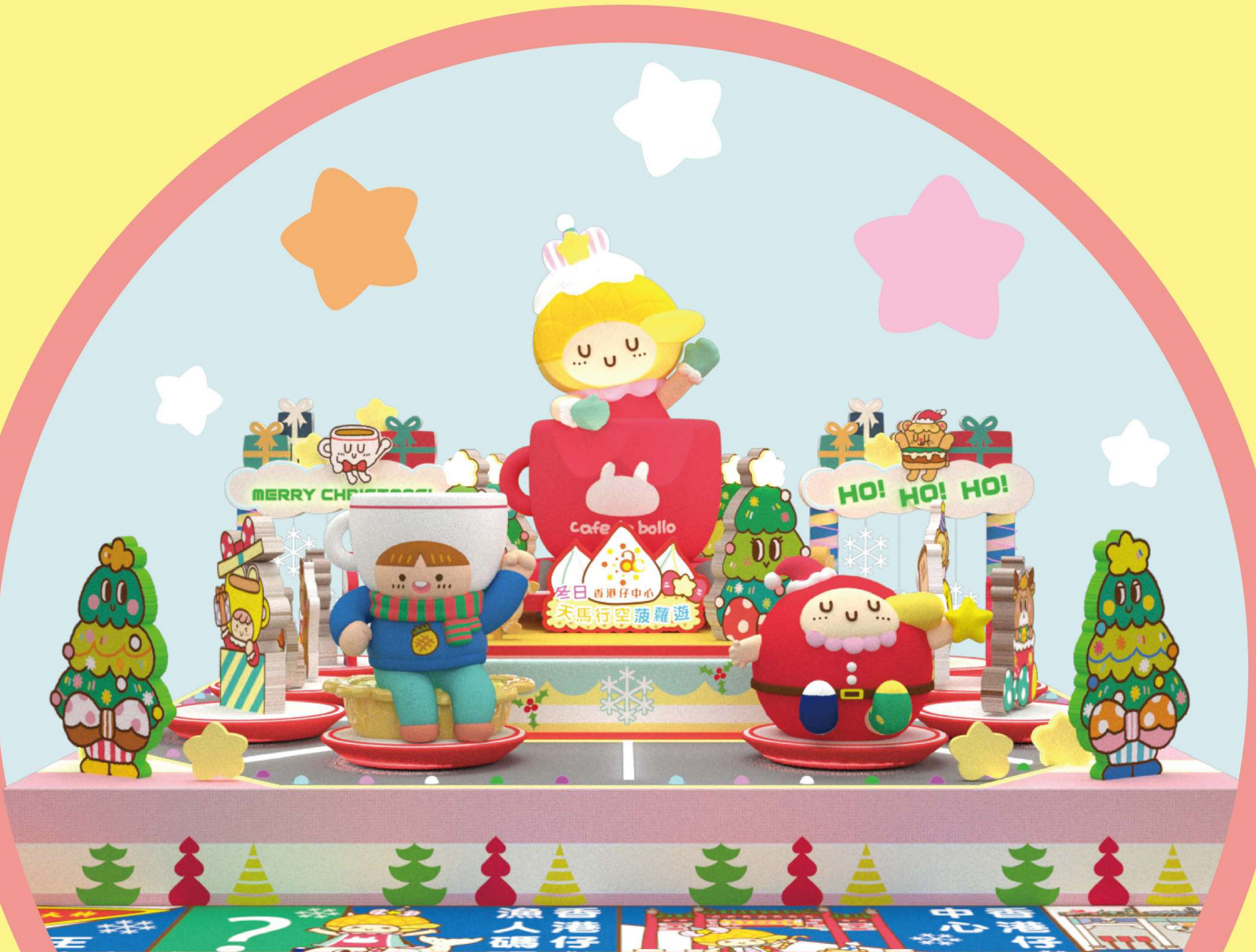
「菠蘿油聖誕奶茶杯」 @香港仔露天廣場

菠蘿油妹妹與香港仔中心攜手呈獻【冬日天馬行空菠蘿遊】，打造3大聖誕拍攝場景，由一眾菠蘿油妹妹朋友們，帶給大家一個富香港特色的甜蜜聖誕。