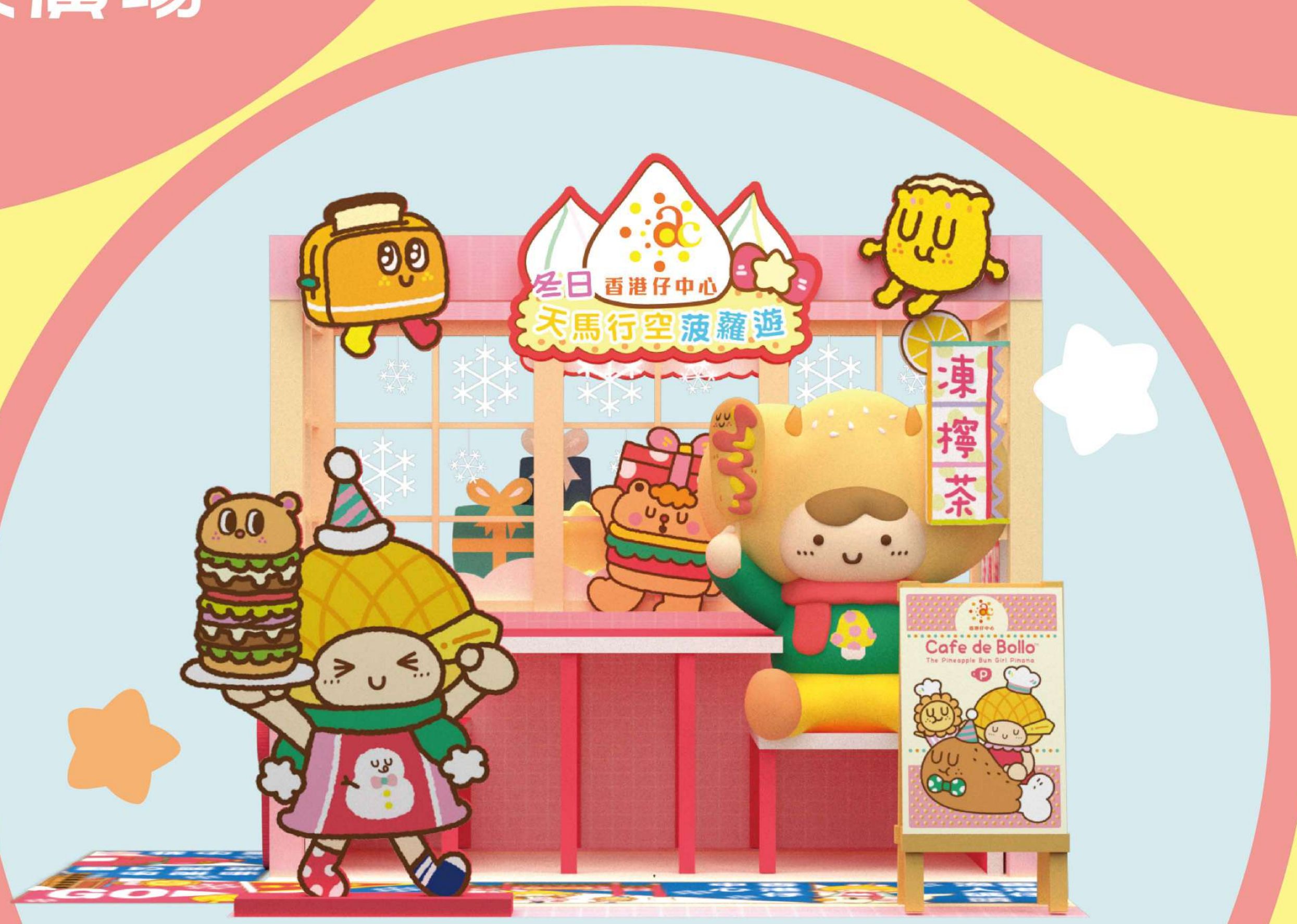
「雞尾包仔仔茶座」 @四期地下