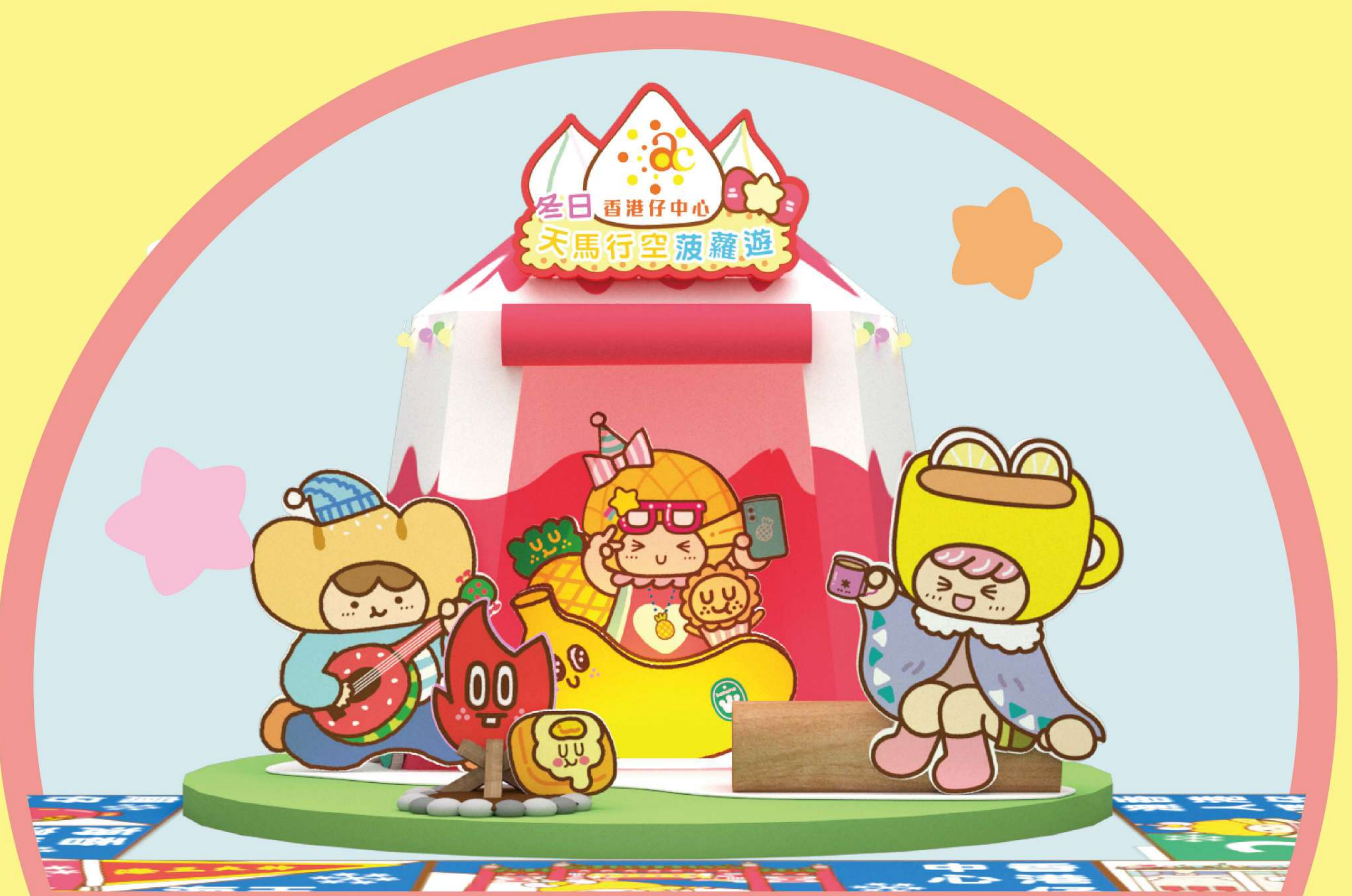
「檸茶妹妹冬日營火會」 @香港仔露天廣場