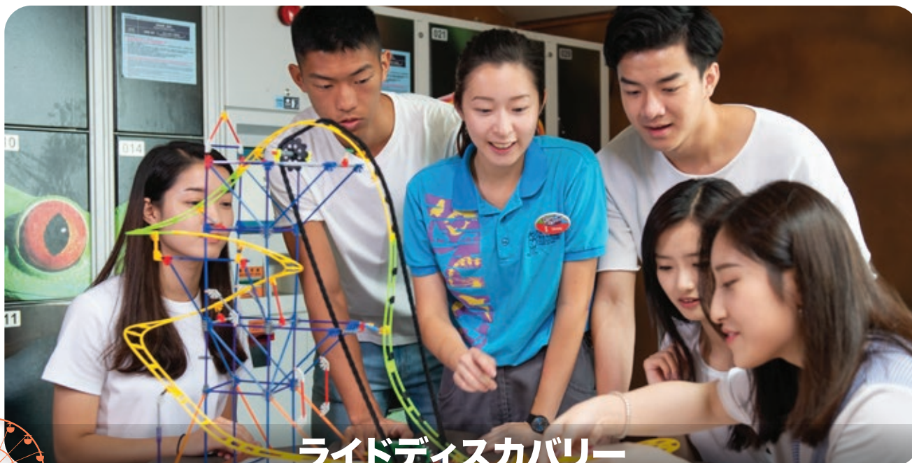
ライドディスカバリー