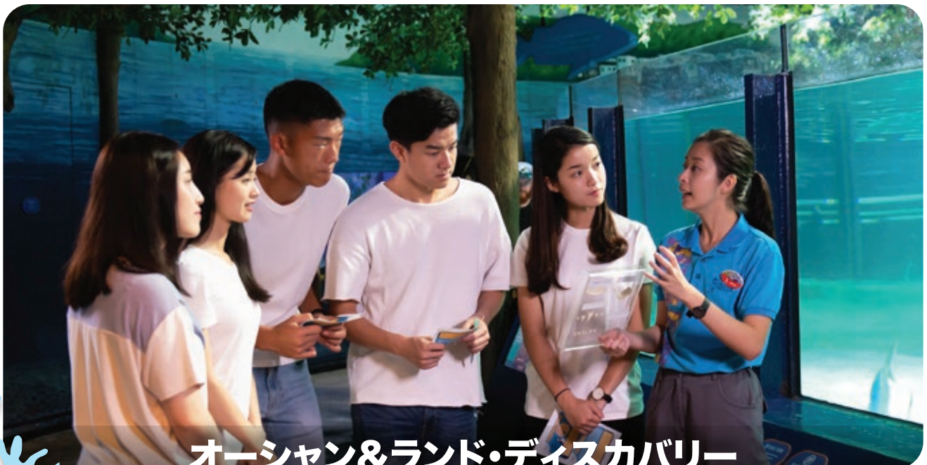
オーシャン&ランド・ディスカバリー