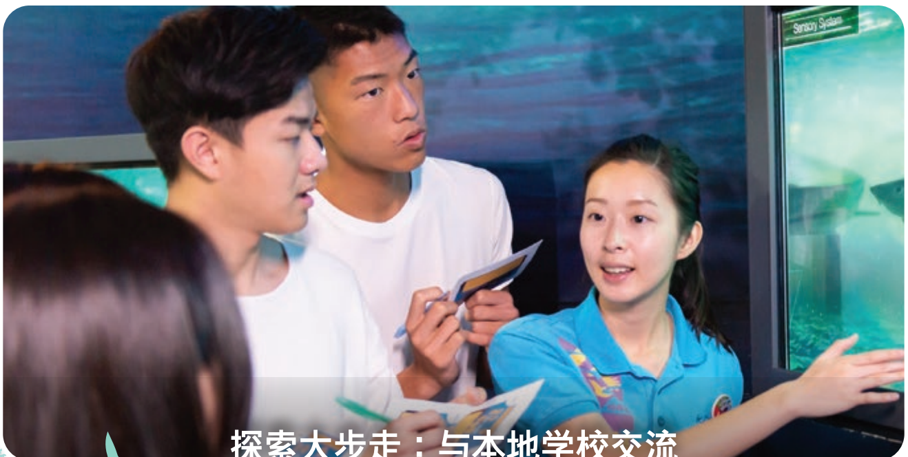
探索大步走：与本地学校交流