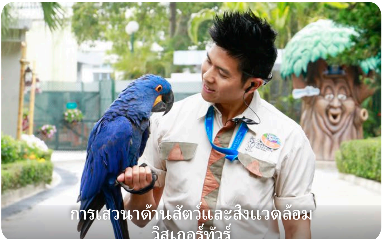
การเสวนาด้านสัตว์และสิ่งแวดล้อม วิสเกอร์ทัวร์